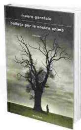
Ballata per le nostre anime , di Mauro Garofalo, Mondadori. Pagg. 340, € 18

Louis è un uomo che ha scelto di allontanarsi da ogni relazione per vivere con troppi rancori e alcol in corpo sulla costa del Golfo del Mississippi. Sarà Layla, un cucciolo di border collie, a offrirgli una seconda possibilità: prendersi cura di lei e così di se stesso. Biloxi di Mary Miller (Black Coffee, traduzione di Leonardo Taiuti, pagg. 264, € 15) è un romanzo scoppiettante e beffardo quanto un classico dei Talking Heads. ☺ _ (Michele Neri)