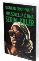
Mia sorella è una serial killer , di Oyinkan Braithwaite, La nave di Teseo. Traduzione di Elena Malanga. Pagg. 240, € 19

Korede è una brava ragazza, un'infermiera provetta, ma è brutta e aiuta sua sorella, l'incantevole e disinvolta Ayoola, a sbarazzarsi dei cadaveri dei fidanzati che lei uccide, uno dopo l'altro. Tutto bene o quasi, finché Ayoola non seduce il dottore per cui lavora sua sorella e di cui è segretamente innamorata. Se si vuole compiere un viaggio irresistibilmente comico e illuminante nella società nigeriana e nella sua esuberante letteratura noir, ecco il libro definitivo.