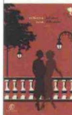
Nel cuore della notte, di Rebecca West, Fazi, 20 euro

La scrittrice britannica Rebecca West (1892-1983)